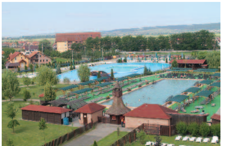
A marosszentgyörgyi fürdő

Jelenleg a fürdőtelep sós vizű stranddal, kádfürdővel rendelkezik. A szakemberek szerint vize hatékonyan kezeli az idegrendszeri, légúti, női bántalmakat és különböző reumás betegségeket is. A sókoncentrárum 150 gramm literenként. Iszappakolást is lehet készíteni. A fürdő három medencével rendelkezik, az egyik mélysége 1,60 m és a