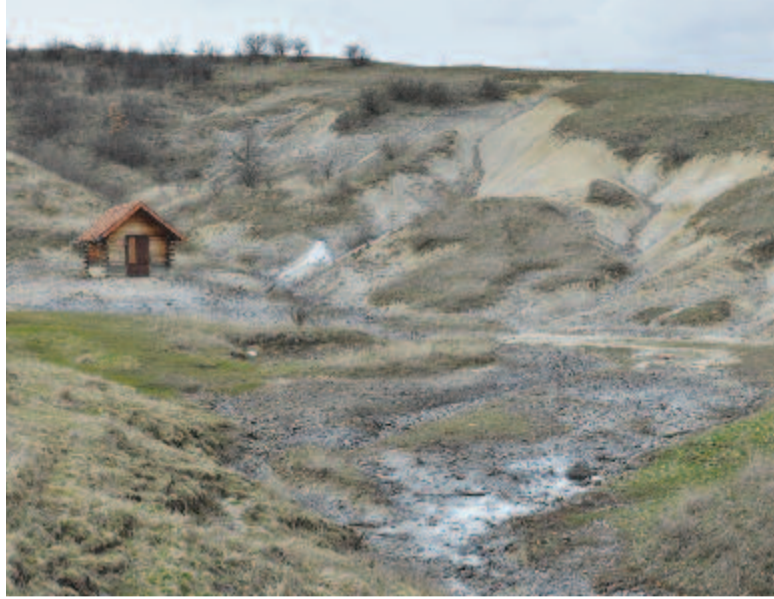
A görgényorsovai sós domb és kút

Görgényszentimre központjából indul ki a megyei út, amely Görgényorsovára és Szécsre (Orsova Pádure) vezet. Orsovát elhagyva, Szécs felé menet, jobb kéz felől a