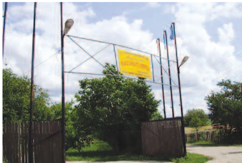
A görgénysóknaik fürdő bejárata

A sós fürdő az egyik tárna beomlásával alakult ki. Az 1700-as években készült osztrák császári katonai térképen Görgénysókna és Görgényszentmárton között 10 kék kört jelöltek be, amelyek sós-